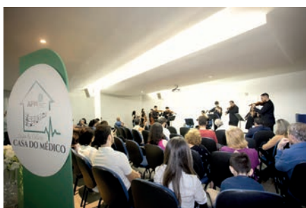
Vernissage teve apresentação da orquestra Órion, do Instituto Alpha Lumen

A APM São José dos Campos inaugurou em grande estilo, no dia 7 de março, a exposição Abstrações . O evento marcou o ingresso da Casa do Médico no Circuito Cultural Central da cidade, apoiado pela Fundação Cultural Cassiano Ricardo. A iniciativa visa fortalecer e ampliar os projetos culturais na região central.