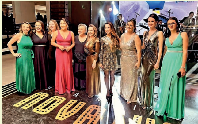
Diretoras da APM São José dos Campos

Um dos objetivos da Nova Gestão da APM São José dos Campos é a representatividade da mulher e a presença da essência feminina na associação. Conseguimos!