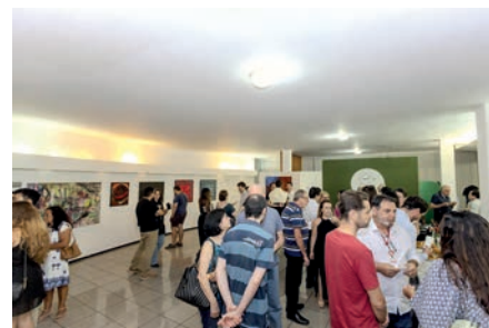
Abstrações estará aberta ao público de segunda a sexta, no horário comercial, até 11/4