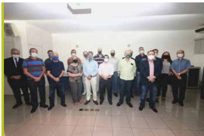
A nova Diretoria da APM São José dos Campos