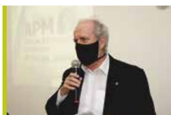
Posse foi realizada junto com a Assembleia Geral Ordinária da APM SJCampos; todas as medidas de higiene e segurança sanitária foram tomadas, em função da pandemia