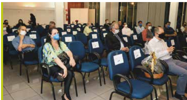
Posse foi realizada junto com a Assembleia Geral Ordinária da APM SJCampos; todas as medidas de higiene e segurança sanitária foram tomadas, em função da pandemia